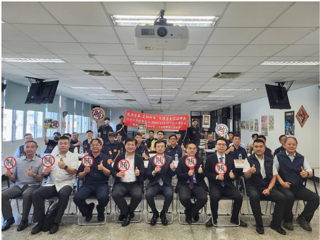
本署王檢察長率同仁前往新北市政府警察局淡水分局分區選舉查察