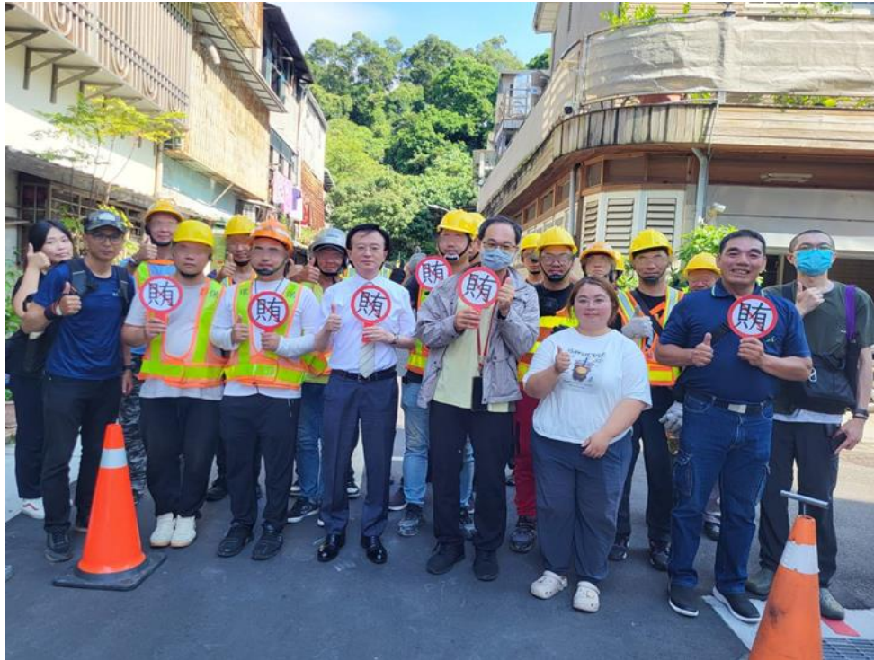
王以文檢察長(前排中間)除了解現場淤泥清理狀況，並關注勞動環境的施作安全。

王檢察長表示，社會勞動的核心價值是給予犯錯的人，有自新的機會，同時特別提醒在場的社會勞動人，115 年地方公職人員選舉將於本（115）年 11 月 28 日舉行，唯有拒絕賄選，才能共同守護民主制度，讓有熱忱、有能力的候選人為人民服務。