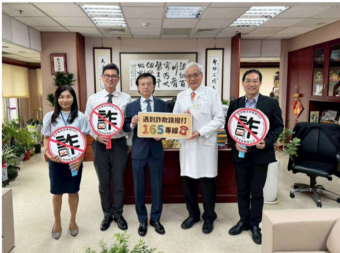
圖三：本署與臺北榮總與會人員合影，展現攜手打擊詐騙、守護國人健康之決心。(右二臺北榮總院長陳威明、右一政風室主任黃俊祥、左三本署檢察長王以文、左二主任檢察官葉耀群、左一政風室主任沈沛樺)